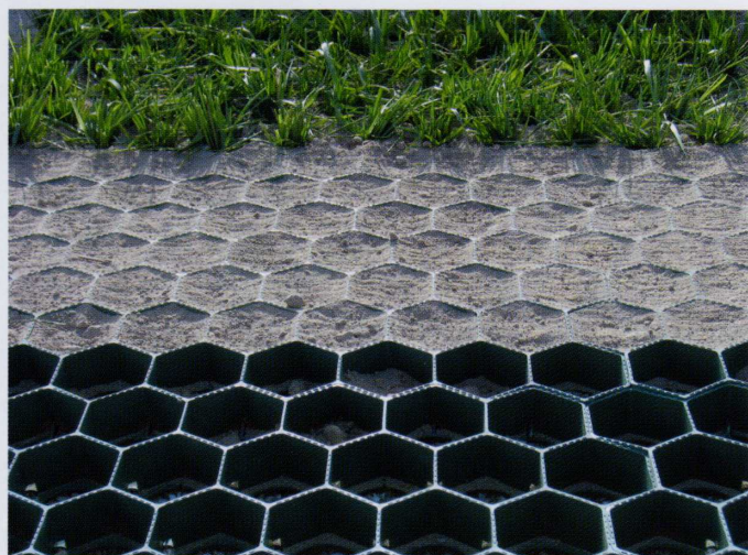
CELDAS MÁS GRANDES